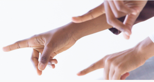
LES CRITIQUES QU'ELLE REÇOIT DE CEUX QUI N'AGISSENT PAS