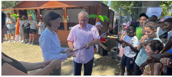
POUVOIR CHANGER LA VIE DES GENS ET AMELIORER LEUR QUOTIDIEN